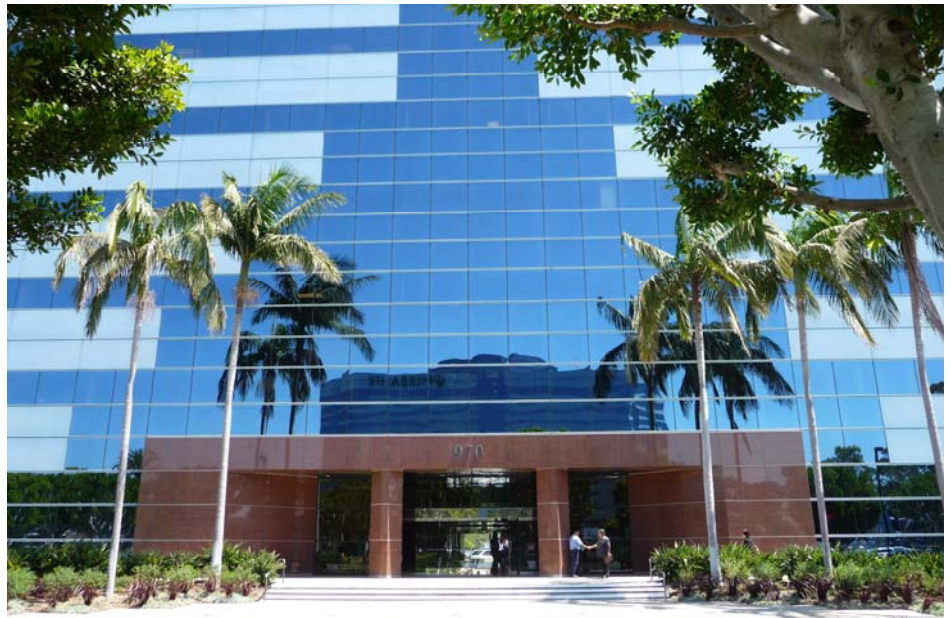
Los Angeles Office

Tokyo : T&G Hamamatsu-cho Bldg. 6th Fl. 2-12-10, Shiba-Daimon, Minato-ku Tokyo 105-0012, Japan Tel: +81-3-6435-6596